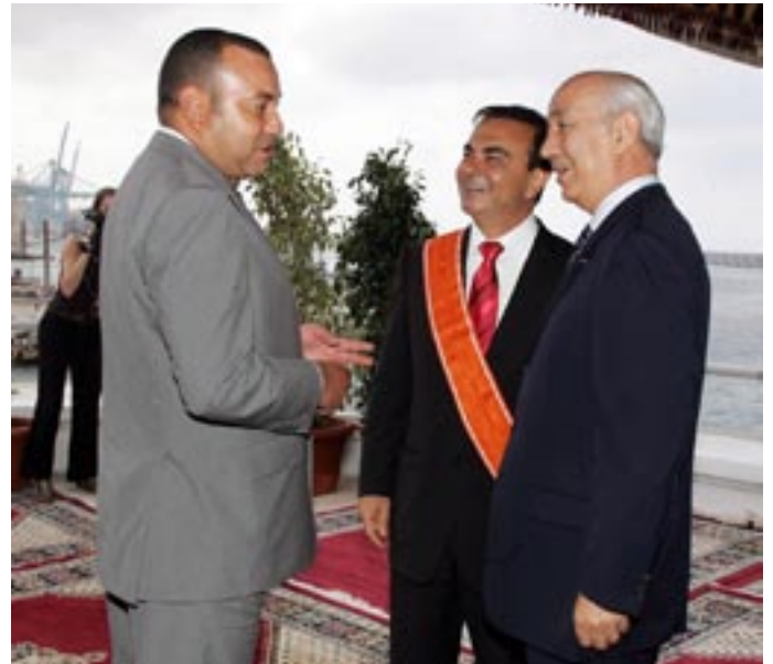
Sa Majesté le Roi Mohamed VI, M. Driss Jettou, Premier Ministre, et M. Carlos Ghosn.

Renault, Nissan et le Royaume du Maroc se sont accordés pour étudier les modalités d'implantation d'un complexe industriel comprenant une usine d'assemblage située sur un terrain de 300 hectares de la Zone Economique Spéciale de Tanger Méditerranée et utilisant la plate-forme portuaire du Port de TangerMed. La capacité installée serait de 400 000 véhicules, avec dans une première étape, une capacité opérationnelle de 200 000 véhicules à partir de 2010. Le montant des investissements capacitaires prévus pour ce projet est estimé à 600 millions d'euros, avec une première phase à 350 millions d'euros. À ce montant s'ajouterait un investissement spécifique compris entre 200 et 400 millions d'euros, en fonction de la variété des véhicules produits.