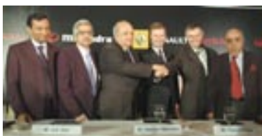
26 février 2007 : Renault, Nissan et Mahindra annoncent la localisation de leur site industriel, à Chennai.

Capitalisant sur le succès de cette joint-venture avec Mahindra, le partenariat entre les deux Groupes se renforce et s'élargit. C'est la seconde étape du développement de Renault en Inde : Chennai (État du Tamil Nadu) accueillera une nouvelle usine dont la capacité installée est fixée à 400 000 unités par an, au plus tard sept ans après son démarrage. Nissan, partenaire de Renault au sein de l'Alliance, est également engagé dans ce projet. L'usine produira des véhicules pour chaque constructeur mais également des moteurs pour Renault et Nissan.