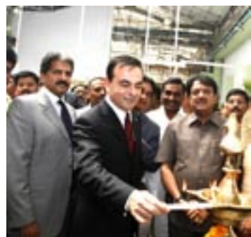
Visite de Carlos Ghosn à l'usine de production de Logan à Nashik.

En avril 2007, les premières Logan sortent de l'usine de Nashik. Leur commercialisation débute alors en Inde.